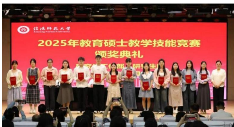
图 13. 2025 年教育硕士教学技能竞赛颁奖典礼

2025 年学校举办了教育硕士研究生教学技能大赛，设置教学技能竞赛与“三笔字”书写两个项目，共评选出教学技能比赛一等奖 3 名、二等奖 6 名，“三笔字”比赛一等奖 12 名。大赛采用“学院—学校—全国”三级联动机制，旨在为研究生提供技能展示与成果交流的平台，同时为全国“田家炳杯”等教学技能大赛遴选优秀选手，为后续参与高层次赛事奠定了扎实基础。