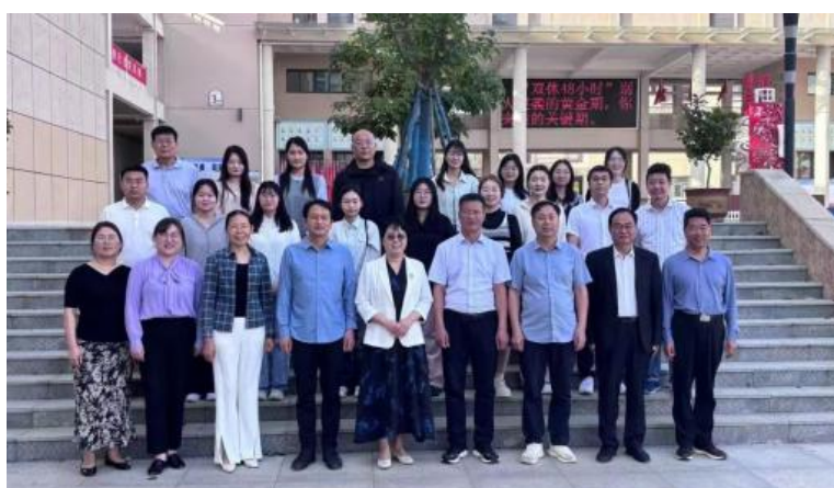
图 8. 学校赴实习实践基地看望教育实习研究生