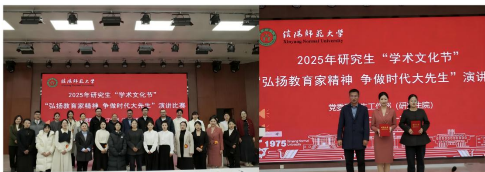
图 3. “弘扬教育家精神 争做时代大先生”主题演讲比赛