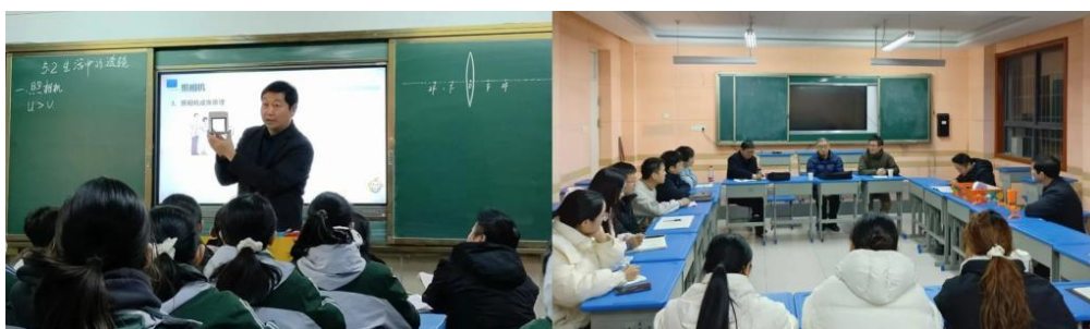
图 7. 教育硕士参与听评课活动

息县等地开展为期一年的“顶岗实习”与“支教服务”，以制度化、沉浸式的实践模式，既有效提升了研究生的教学实践能力，也缓解了当地师资紧缺问题，获得地方教育行政部门与实习学校的一致好评。在实施过程中，通过建立常态化沟通机制与全过程精细化管理，强化“有组织地指导”，突出实践教学的“教育性”“教学性”“研究性”“系统性”和“融合性”，推动学生在真实教学情境中应用理论、反思实践、提升育人智慧。此外，学校每年召开实践先进个人表彰大会，宣传优秀实践成果，积极营造重实践、强能力的育人氛围。2025年共评选出96名优秀实习生，集中体现了学位点在实践教学方面的扎实成效与人才培养质量。