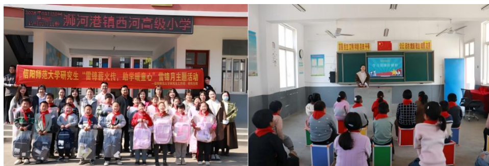
图 4. 开展“雷锋薪火传·助学暖童心”雷锋月主题活动