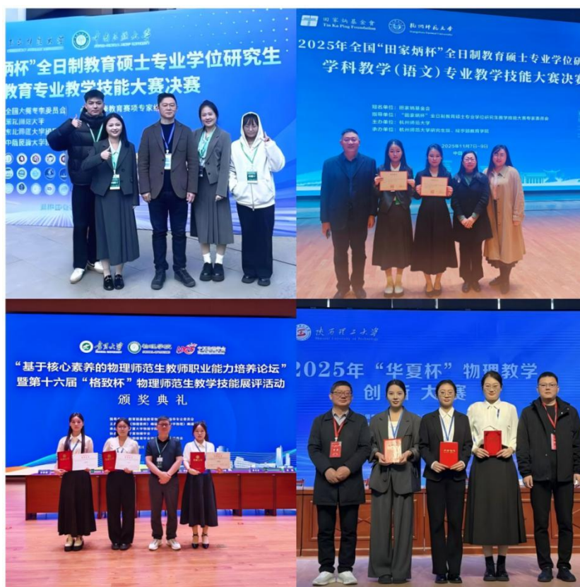
图 17. 教育硕士参加各类教学技能比赛